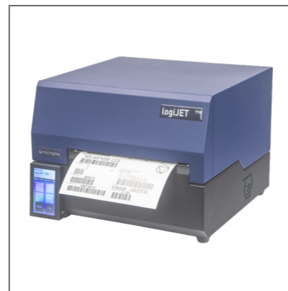
Impresora térmica - i.e. logiJET TT8