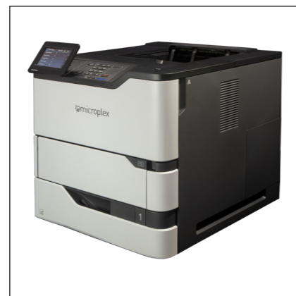
Impresora de hojas suelta - i.e. SOLID 52A4