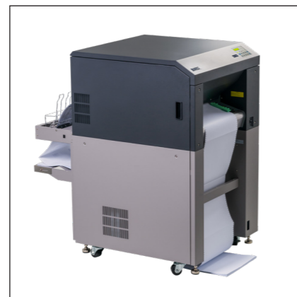
Impresora papel continuo - i.e. SOLID F40