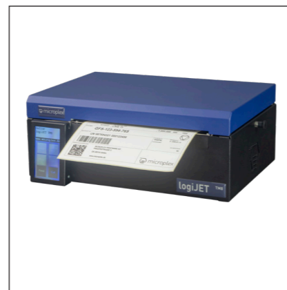
Impresora térmica móvil - i.e. logiJET TM8