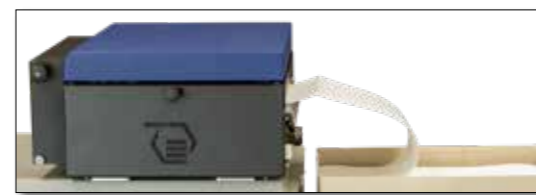
logiJET TM8 - Alimentación de papel plegado en zigzag

La alimentación de papel a través de una pila o un rollo garantiza un transporte de papel sin problemas hacia la impresora. Las cubiertas superiores se separan después de la impresión mediante un cortador opcional. A partir de aquí, las hojas individuales resultantes pueden ser recogidas por la planta de procesamiento y transportadas. Puedes utilizar la alimentación externa de papel para adaptar de manera flexible el suministro de papel a tus necesidades, de modo que, por ejemplo, puedas producir un cambio de turno sin tener que cambiar de papel. Aquí se muestra el ejemplo del logiJET TM8 .