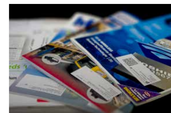
Revistas con la etiqueta Cheshire