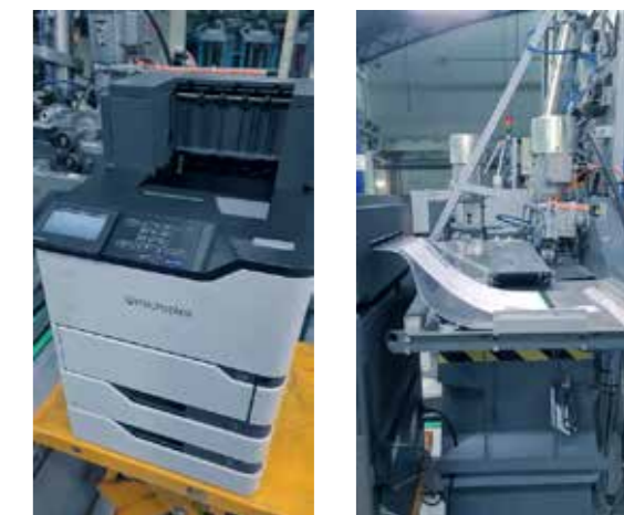
SOLID 52A4 en la sala de expedición del periódico